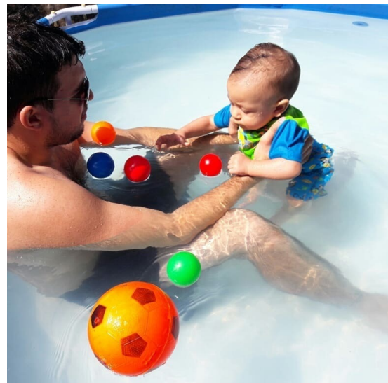
COLABORADORES - LICENCIA PARENTAL - CWP - +MÓVIL