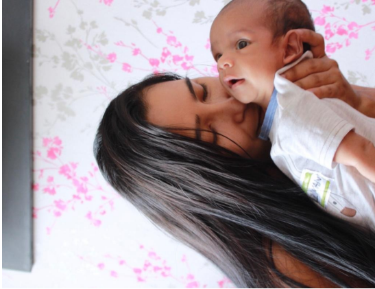
COLABORADORES - LICENCIA PARENTAL - CWP - +MÓVIL