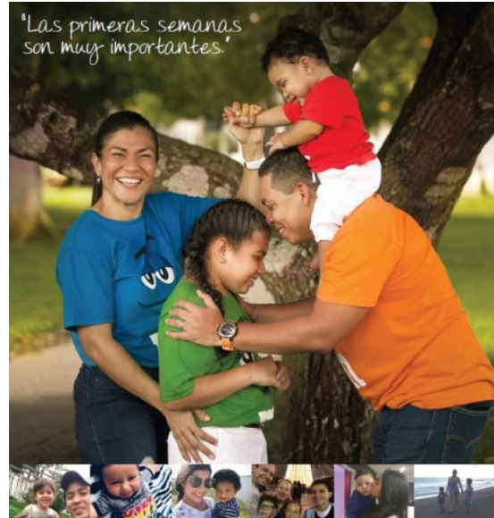
Promocional Licencia Parental CWP - +Móvil

LICENCIA DE MATERNIDAD Y PATERNIDAD PAGADA. PARA TODOS.