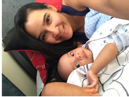
COLABORADORES - LICENCIA PARENTAL - CWP - +MÓVIL