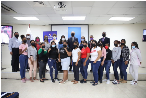
Inicio oficial del primer bloque de entrenamiento enfocado en seguridad Industrial