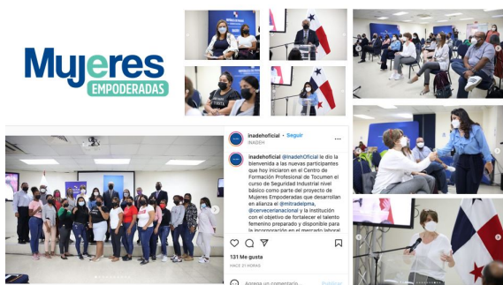
Primer bloque de entrenamiento enfocado en seguridad Industrial