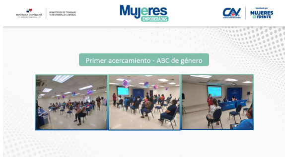
Primer acercamiento capacitación ABC género