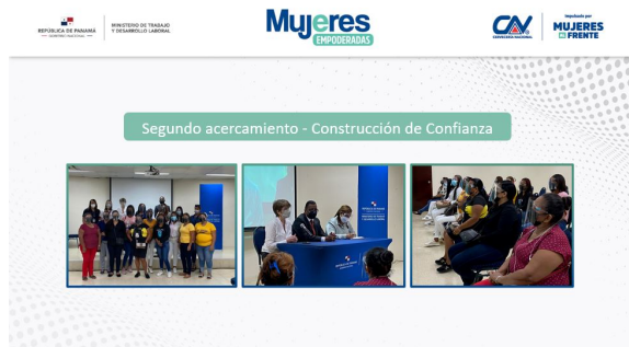
Segundo acercamiento - construcción de confianza